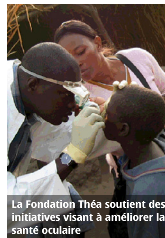
La Fondation Théa soutient des initiatives visant à améliorer la santé oculaire

Si vous êtes porteur d'un projet conforme aux priorités de la Fondation, merci de bien vouloir nous contacter : s.bouvier@fondation-thea.com www.laboratoires-thea.com/fr/fondation